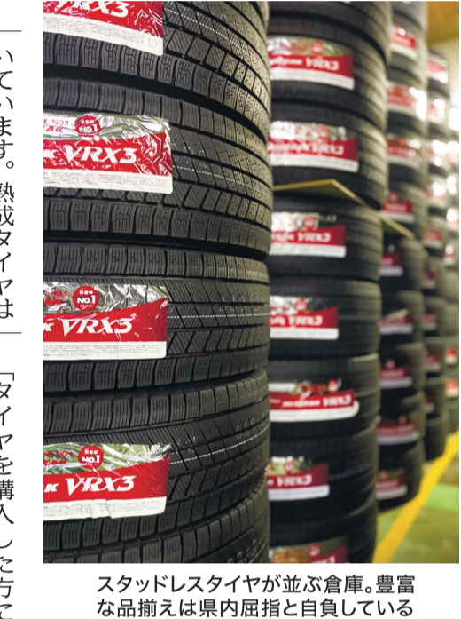
スタッドレスタイヤが並ぶ倉庫。豊富な品揃えは県内屈指と自負している

スタッドレスタイヤ専門店のスタッドレスタイヤフェア開催 お得な情報満載の裏面もご覧ください。