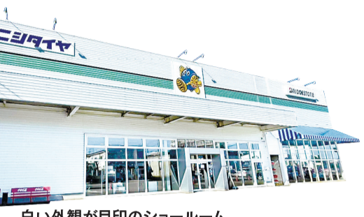
白い外観が目印のショールーム

10月も半ばを迎え、県内のタイヤ販売店は冬タイヤを求めるドライバーで活気づいています。「良いタイヤをより安く」がモットーのタイヤ・ホイール専門店「コニシタイヤ」(秋田市土崎)では、10月11日から11月10日まで「スタッドレスタイヤフェア」を開催します。お得なフェアの内容を同店店長に聞きました。